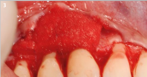
3 Positionierung von Geistlich Fibro-Gide® und Fixierung mit Einzelknopfnähten (7/0 PGA-Nähte).