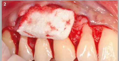
2 3 mm Geistlich Fibro-Gide® wird in den Defekt eingebracht und absorbiert sofort Blut.