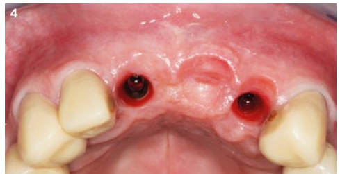
4 Austrittsprofil 3 Monate nach Konditionierung des Weichgewebes mit provisorischer Brücke.