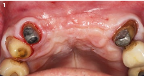
1 La vista preoperatoria muestra la falta de convexidad vestibular.