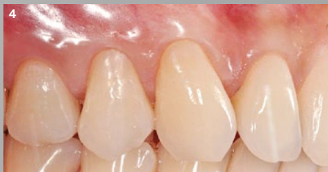
4 Seguimiento después de 12 meses: se ha logrado el cubrimiento completo de la raíz con Geistlich Fibro-Gide®