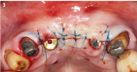
3 Cierre primario de la herida.