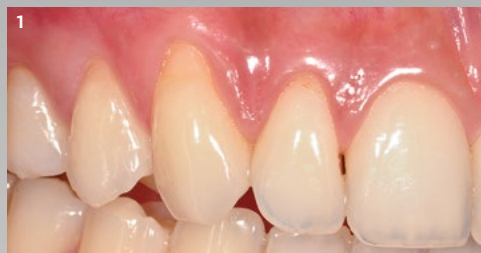
1 Situación inicial: defecto de múltiples recesiones clase I de Miller con menos de 3 mm de tejido queratinizado en los dientes de 12 a 14