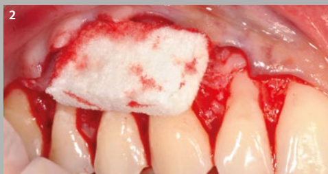
2 Se coloca una matriz de 3 mm de Geistlich Fibro-Gide® que absorbe inmediatamente la sangre